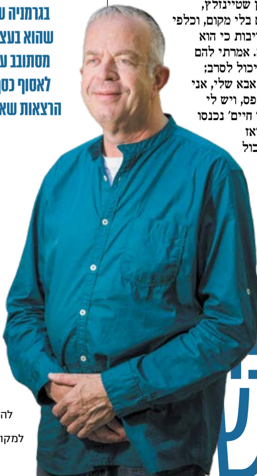
לא רציתי להפוך עזרה לאנשים למקור פרנסה. פלוסר

"לאנא לא היה שום יחס לכסף. הוא חיבר ספרים חשובים שתורגמו לשפות רבות, אבל אף פעם לא חתם על חוזי זכויות ולא קיבל תמלוגים. כשאמרנו לו פעם שאולי יחתום סוף-סוף על חוזה, הוא התרגז וצעק 'רק כסף יש לכם בראש!'. אני תכיר מישהו בגרמניה שמספר שהוא נעצמו היה מסתובב עם כובע לאסוף כסף אחרי הרצאות שאנא נתן שם"