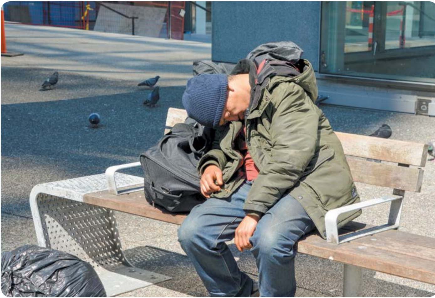
כשעובד סוציאלי אחראי על 300-400 תיקים, אי אפשר לטפל כמו שצריך. אילוסטרציה

בזמן לימודיו ברחובות נהג פלוסר לקפוץ למכון ויצמן הסמוך, ולהקשיב שם להרצאות של פרופ' ישעיהו ליבוביץ בתחום הפילוסופיה של המדע. את התואר השני שלו כבר עשה בתחום הזה. "חשבתי שאעסוק בפילוסופיה של המדע, כי זה מאוד עניין אותי. לא רציתי לקחת את העזרה שלי לאנשים ולהפוך אותה למקצוע ולמקור פרנסה. לכן גם לא